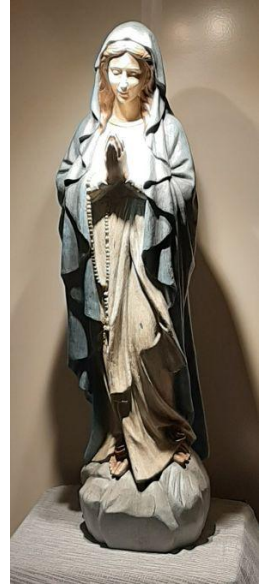
Beeltenis van Maria in de Maria Magdalenakapel.

Lief Vrouwke, ik kom niet om te zingen, maar om een poos bij U te zijn. Ik heb U niets te bieden, niets te vragen, deze dag. Laat voor mij alleen de grote vreugde, als ik Moeder zeggen mag (x2).